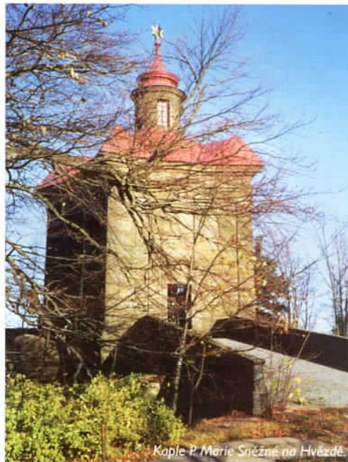
Kaple P. Marie Sněžné na Hvězdě.

Hřebenovka Broumovskými stěnami směřuje od Hvězdy členitými partiemi nad obec Slavný, kde je též parkoviště „na konečné“ silničky z Police nad Metují a Suchého Dolu. Nad Slavným mineme řadu neobvykle modelovaných skalních útvarů. Patří k nim bizarní útes, kterému dala lidská obrazotvornost poněkud pikantní pojmenování Čertova tchyně, blízké okolí je pak doslova „poseto“ skalkami, které připomínají obří houby, a proto jsou označovány jako Slavenské hřiby nebo prostě Hřiby. Jsou výsledkem postupného zvětrávání různě odolných vrstev pískovců a do košíku by se nám jistě nevešly – ty „nejpovedenější“ kamenné hřiby jsou totiž i několik metrů vysoké.