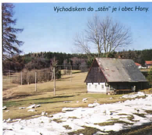
Východiskem do „stěn“ je i obec Hony.

Přes Honský Špičák přechází modře značená cesta z Honského sedla (na silnici z Police nad Metují do Broumova) a jeho nescalnatý, lesem zarostlý vršek nabízí jen omezený výhled. Zajímavější partie najdeme až v dalším pokračování této cesty, kde nad hranou strmého svahu budí pozornost tzv. Laudonovy valy. Jde o zbytky příkopů a valů, které byly v polovině 18. století součástí obranné linie generála Laudona proti vpádu pruského vojska. Modré značky pokračují až ke křižovatce cest pod chatou Hvězda, za Laudonovými valy z nich lze vystoupit po lesní cestě ke skalní partii pod Strážnou horou s působivou pískovcovou věží Kačenkou.