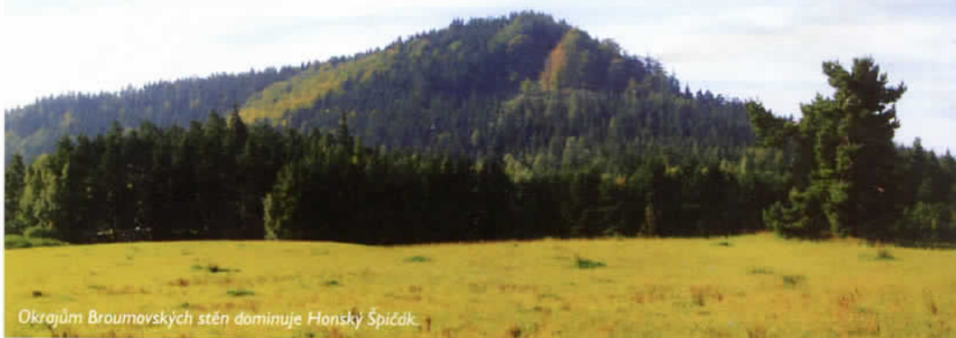
Okrajům Broumovských stěn dominuje Honský Špičák.

Kamenný „houbařský ráj“ zdaleka není jedinou zajímavou partií v blízkosti obce Slavný. Pokud pro další pokračování vycházky Broumovskými stěnami zvolíme žluté značení, záhy nás pohltí členitý skalní terén Zaječí a Třešňové rokle s bizarní věží Lucifer. Odtud cesta stoupá na Vysokou kupu, kde se „proplete“ nevelkým skalním bludištěm, a krátkou odbočkou dojdeme ke Kamenné bráně, což je jedna z nejpůsobivějších skalních bran v našich pískovcových oblastech. Je asi pět metrů široká