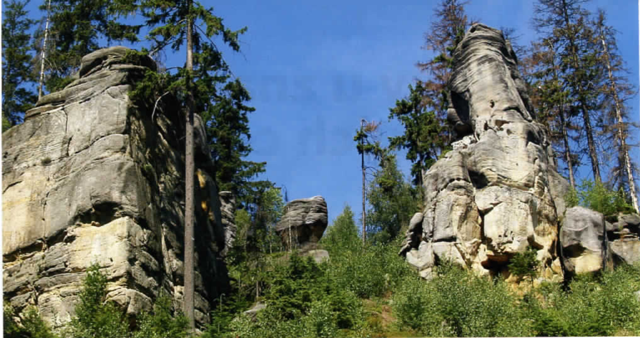
Skalnaté srázy Ostaše