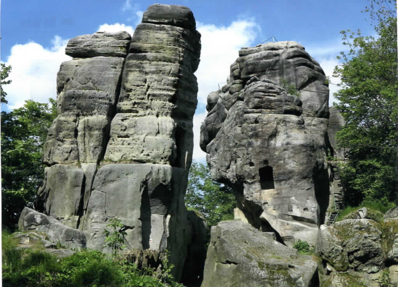
Zbytky hradu Skály splývají s pískovcovými útesy

k názvu zdejší přírodní rezervace, vyhlášené v roce 1956, celému kopci dal pojmenování železný kříž, zasazený do vrcholové skalní plošinky. Tam končí též výstupová trasa a návštěvníkům se odtud nabízí vskutku nevšední výhled na panorama Adršpašských skal, za kterými vykukuje i charakteristický hrot krkonošské Sněžky. Křížový vrch je ze všech stran roubený soustavou pískovcových skal, přístupných ovšem jen horolezcům. Při pohledu zpovzdálí, například z Adršpašských skal, zaujme především výrazně vyčnívající skalní věž, přiléhavě zvaná Maják.