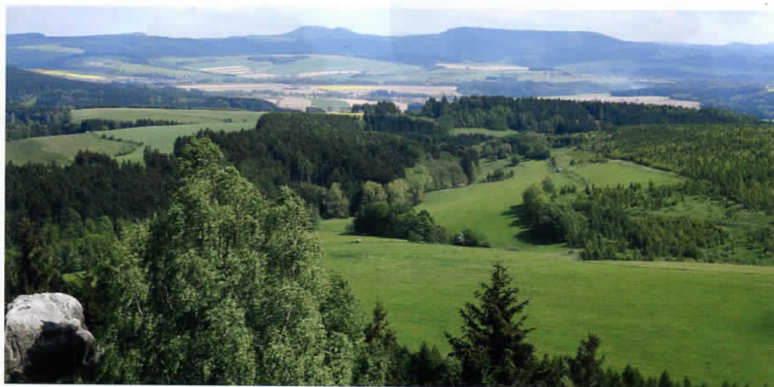
Malebná krajina Broumovska z vrcholku Čápa

Také ten nese jméno Skály, ale běžně se mu říká též Bischofstein (Biskupský kámen) či poněkud „famiiliárně“ Bišik, případně Katzenstein – Kočičí kámen.