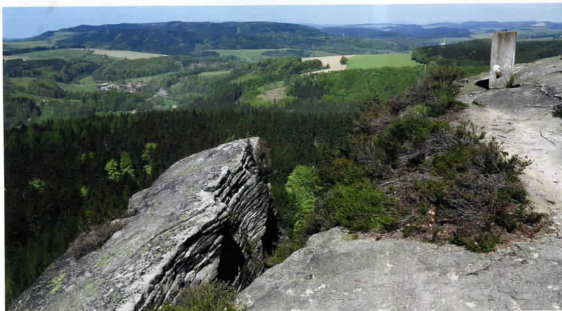
Také vršek Ostaše potěší pěkným výhledem

Okruh Horním bludištěm vrcholí na vyhlídkách při okrajové hraně kopce a jedna z nich – zvaná Frýdlantská – tvoří i vlastní vrcholek Ostaše. Nabízí úchvatné panorama severní části CHKO Broumovsko s hraniční „hrbatinou“ Javořích hor a plošinou Adršpašsko-teplických skal, za jasných obzorů jsou dobře vidět i Krkonoše. Z ptačí perspektivy tu přehledněme také skupinu pískovcových věží Kočičích skal v tzv. Dolním bludišti, za jejich prohlídkou však musíme sestoupit zpět do osady Ostaš.