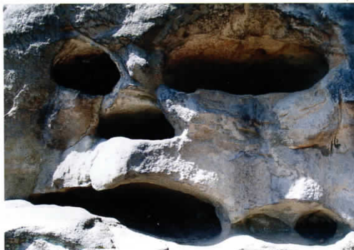
Podivná hříčka přírody - Mohyla smrti