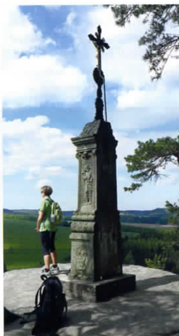
Rozhlédnutí od kříže na Křížovém vrchu

V blízkosti Adršpašsko-teplických skal provázejí opačný, tedy levý