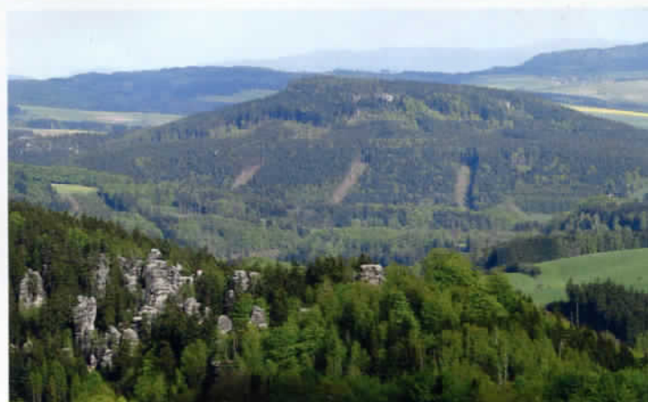
Pohled na stolový vrch Ostaš přes Skalský hřbet