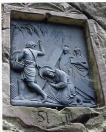
Z křížové cesty na Křížovém vrchu

Při návštěvě zdejších skalních oblastí bychom neměli vynechat neobyčejně zajímavý a zároveň poněkud tajemný vrch Ostaš (700 m). Typickým tvarem skloněné stolové hory zaujme už z širokého okolí a od silnice z Police nad Metují do Teplic a Broumova k němu stoupá krátká odbočka s parkovištěm u chatové osady Ostaš. Odtud se rozbíhají značené cesty ke dvěma skalním bludištím – Hornímu ve vrcholové partii kopce a Dolnímu při východním úpatí s pásmem Kočičích skal. Jen málokterý kopec je opředen tolika legendami a hrůzostrašnými zkazkami, jako právě Ostaš. Patrně nejpohnutější událostí zdejšího kraje byl vpád slezského vojska ve dvacátých letech 15. století. Tehdy se lidé z celého okolí ukryli ve skalních slujích Ostaše, byli však vyvrženi místním mlynářem