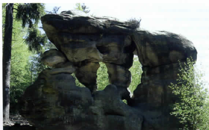
Pitoreskním Čertovým autem se nesvezeme