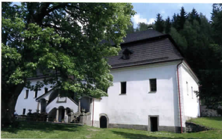
Půvabný skalský Zámeček