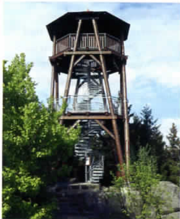
Místo dalekých výhledů - rozhledna na Čápu

zvedá strmý „suk“ Křížového vrchu (667 m), na jehož vrcholek lze vystoupit odbočkou ze žluté značené cesty, spojující obce Adršpach a Zdoňov. Výstup po západním svahu usnadňuje nedávno zrekonstruované schodiště, cesta se pak proplétá kolem památné křížové cesty, vytesané do skalních stěn už v 17. století a zvýrazňující romantiku tohoto méně navštěvovaného místa. Její nynější podobu tvoří soubor vkusných litinových reliéfů. Křížová cesta byla též inspirací